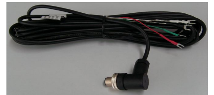
연결선의 길이 5m